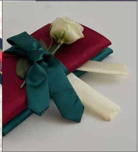
조각보 봉투 포장